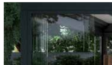
Skjutväggar av glas