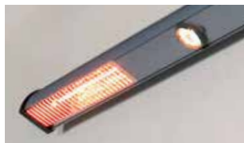
Belysning och värme